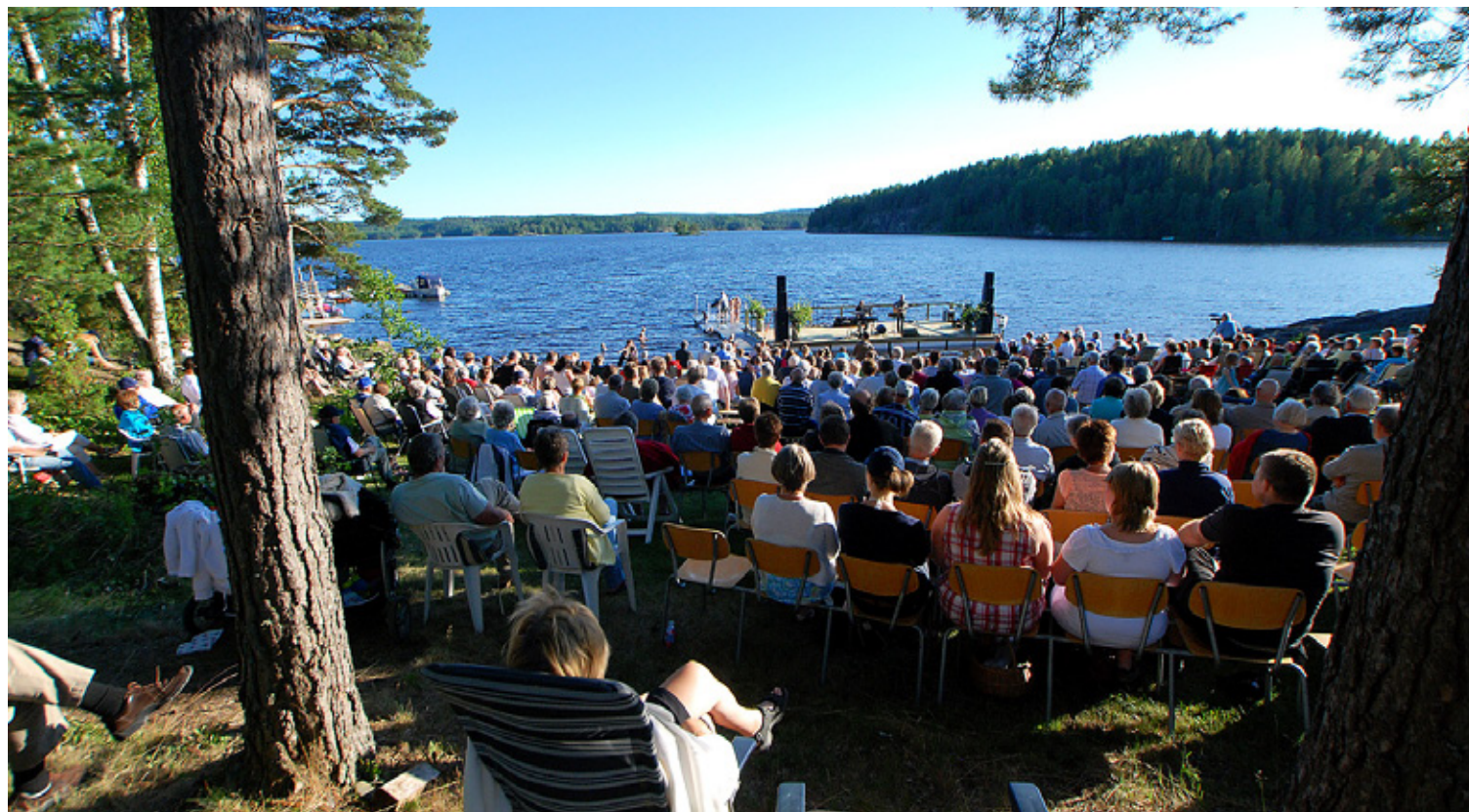
Fangekasa inviterer til Bedehussang i Grenseland for tredje gang, og bibelcamp for 29. gang. Her fra friluftsscena på Aremarksjøen.

Fangekasa i Aremark er blitt et kjent begrep landet rundt, og den entusiastiske dugnadsgjengen på stedet inviterer i år til bibelcamp for 29. gang. Bibelcampen varer fra 30. juni til 29. juli.