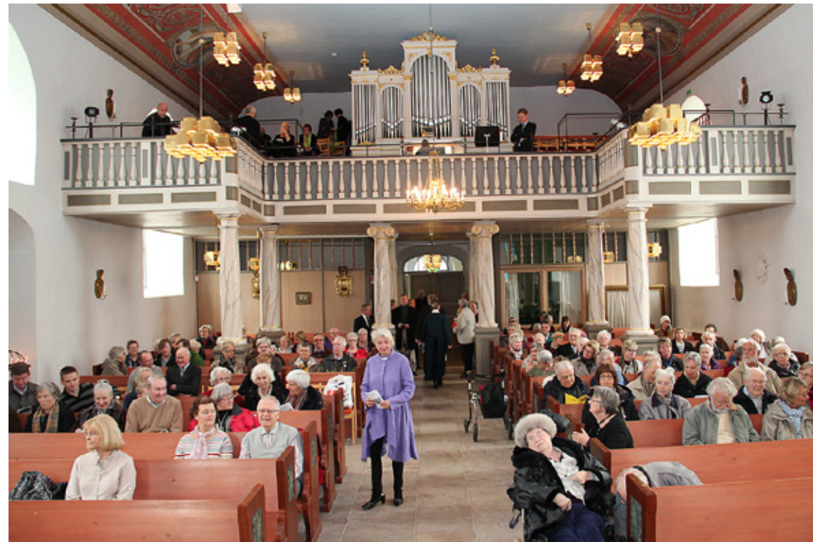
Haldensere er i ferd med å fylle opp benkeradene i Strömstads kyrka.

«Kyrkans förbön» ble lest som «Psalm 700:1» og var vedlagt programmet. Svensk dåp var litt spesiell, idet dåpsbarnet ikke ble båret/holdt av en gudmor/gudfar, men av liturgen selv! Med ryggen mot