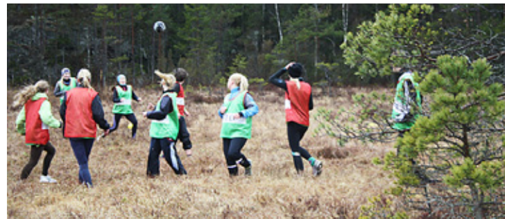
Alle ga alt i årets myr fotballkamp.