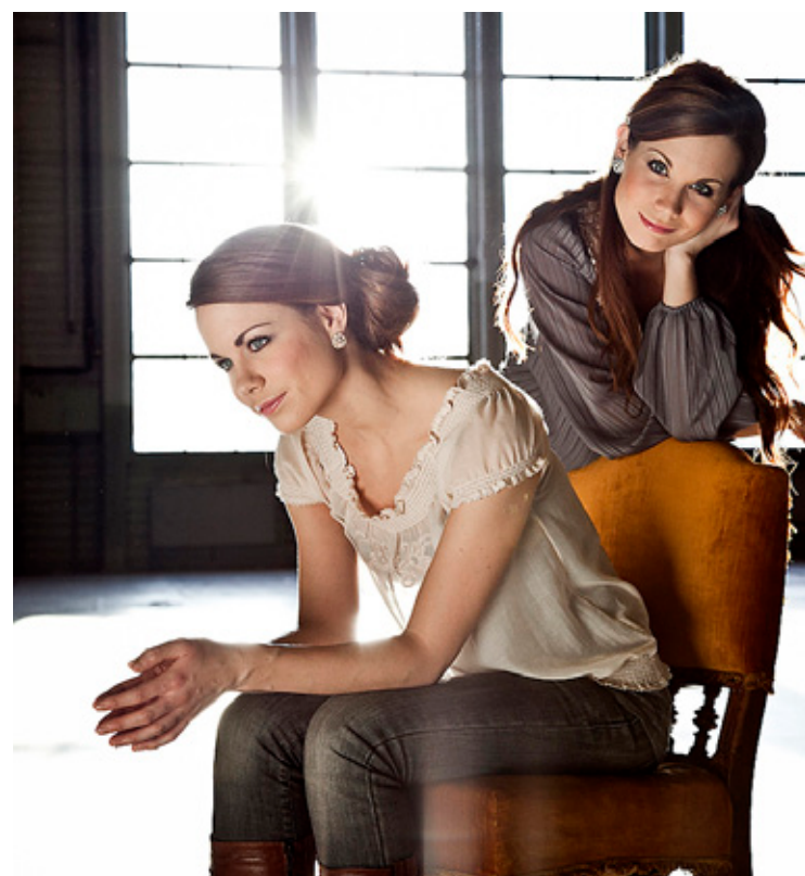
Garness deltar på årets bibelcamp.

Årets bibelcamp har dette innholdet: 30. juni–8. juli: Bedehussang i Grenseland med en rekke