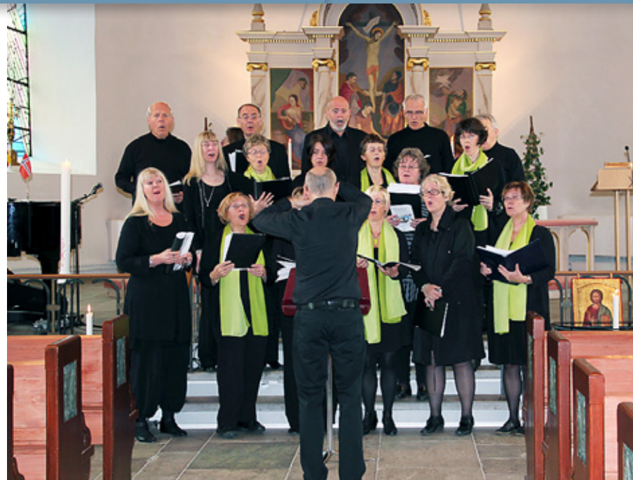
La Capella deltok, blant annet med verset i «Gloria»

den svenske Högmässan. Det medbrakte koret sang flere sanger og avsluttet også med vakkert postludium.